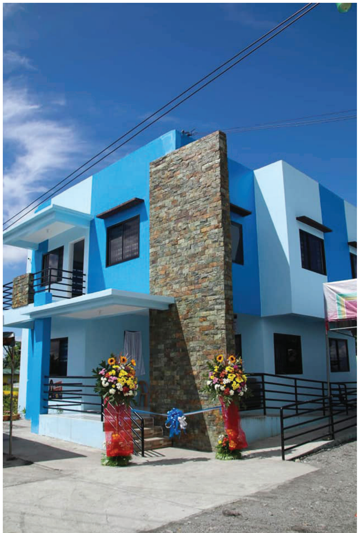
Blessing of City Project - Barangay Biga Multi-Purpose Building, inaugurated by City Mayor Arnan C. Panaligan and City Vice Mayor Gil G. Ramirez.

THE TAMARAO JOURNAL IS A WEEKLY NEWSPAPER CIRCULATING IN THE PROVINCE OF ORIENTAL MINDORO, ISSUED EVERY WEDNESDAY. OFFICE: IBABA WEST, CALAPAN CITY, OR. MIN. CONTACT: 09175668361 EMAIL ADD: TAMARAOJOURNAL@GMAIL.COM