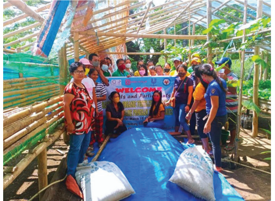
Participants at the actual demonstration of organic fertilizer production

AS PART OF ITS COMMITMENT to empowering communities with livelihood opportunities, DOST- MIMAROPA conducted Training on Organic Fertilizer Production for Kabisig ng Kalahi (KNK) Food Share Program (FSP) beneficiaries, and some selected women members of Samahan ng Kababaihan in Barangay Rumbang, Rizal Occidental Mindoro last March 15-16, 2022. The training program provided the beneficiaries with the skills to make their organic fertilizer from domestic and agricultural wastes.