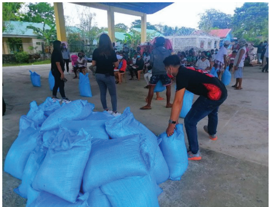
Distribution of rice to beneficiaries of the Food Share Program